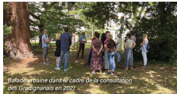
Balade urbaine dans le cadre de la consultation des Gradignanais en 2021

Menée conjointement avec la FAB, agence d'aménagement de Bordeaux Métropole, la ZAC Cœur(s) de Gradignan concerne trois secteurs du centre-ville (Laurenzane, Ermitage/La Clairière et la Cité Jardin) sur un total de 30 hectares. La démarche est de réaménager une partie du centre, dans le même esprit que la place Bernard Roumégoux et ses abords (finalisés en 2019). Un projet d'ampleur mené sur une quinzaine d'années et qui vise à relier et redynamiser ces trois secteurs.