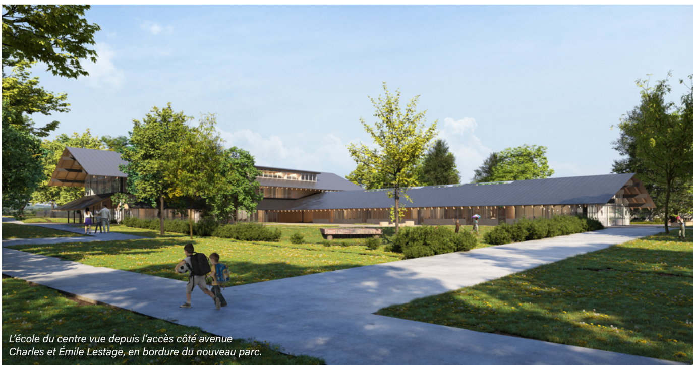
L'école du centre vue depuis l'accès côté avenue Charles et Émile Lestage, en bordure du nouveau parc.