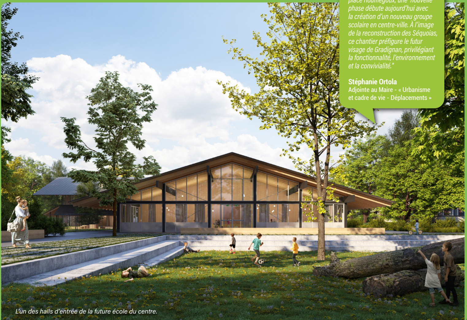
L'un des halls d'entrée de la future école du centre.