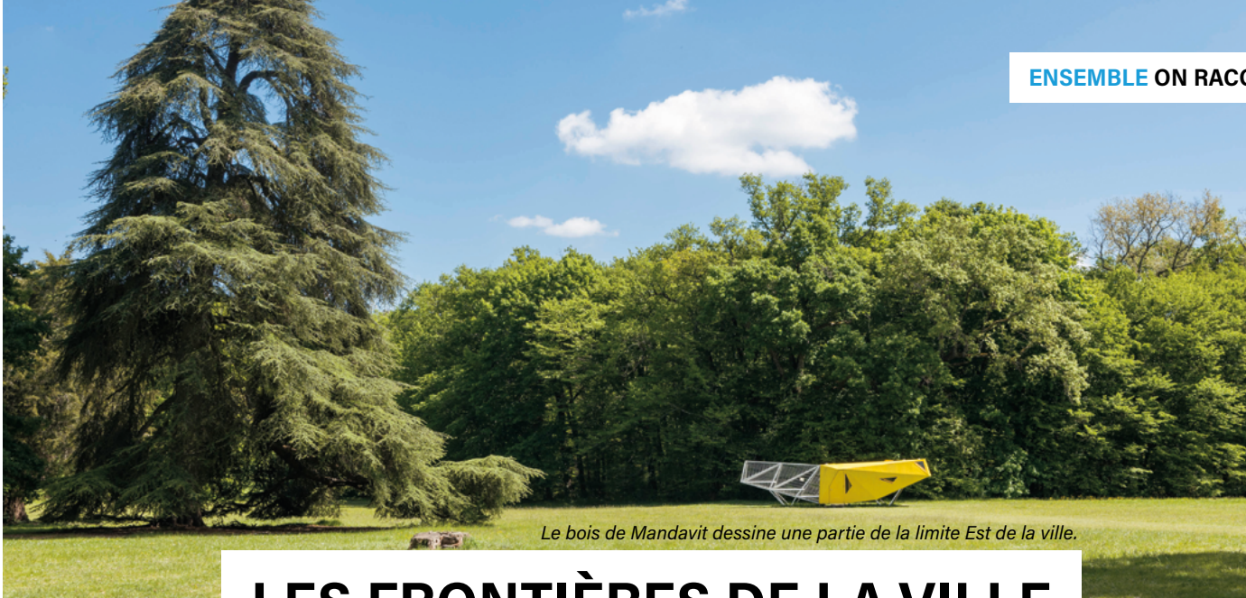
Le bois de Mandavit dessine une partie de la limite Est de la ville.